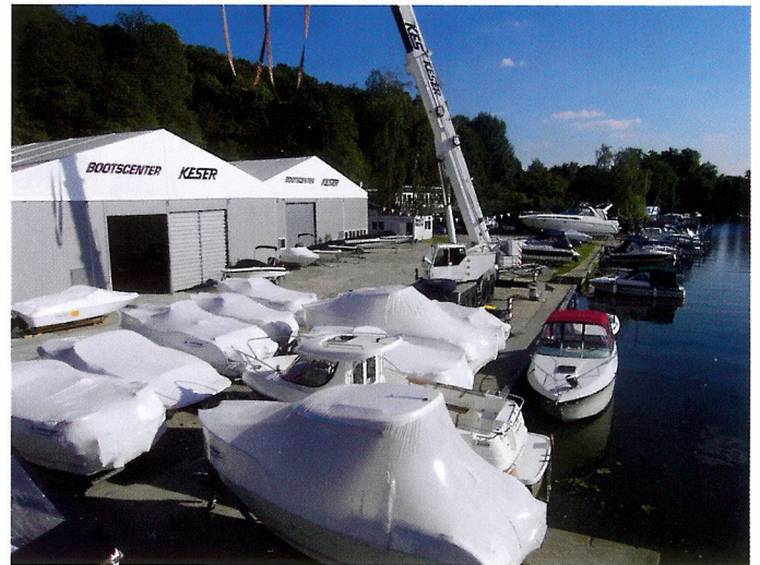
Auf dem großen Gelände des Bootscenter Keser an der Berliner Heerstraße findet zwischen den Feiertagen die Weihnachts-Bootsmesse statt.

Dort findet auch die große Keser Weihnachtsmesse statt mit der laut Keser größten Bayliner und Quicksilver Ausstellung Europas und zahlreichen weiteren Booten, Attraktionen und natürlich auch gepflegten Gebrauchbooten. Vom 27. bis zum 30. Dezember