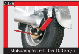
Stoßdämpfer, erf. bei 100 km/h