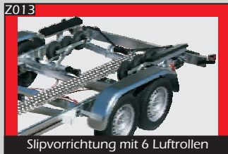
Slipvorrichtung mit 6 Luftrollen